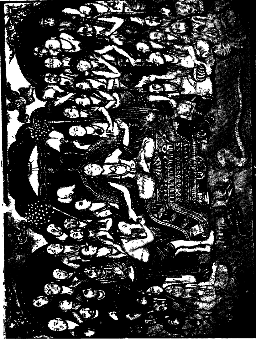
Sri Vyasaraja warding off the Kuhu-yoga of Sri Krishna Devaraya

राजाधिराज सपुत्र्य सर्वैष्यवशेखर । गजगह्वर कर्नाट सिंहासन गतप्रभो ॥